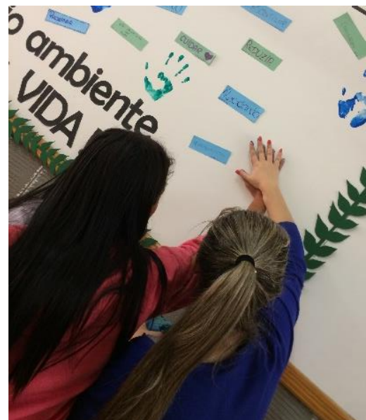
Integração dos alunos e Pibidianas na construção