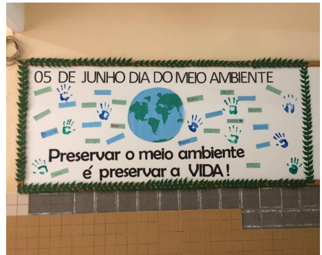
Mural do Dia Do Meio Ambiente