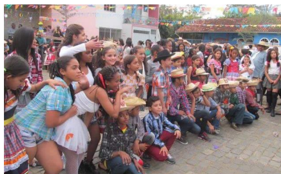
Alunos na festa

No dia 15 de julho aconteceu uma linda festa junina na E. E. Alice Loureiro. O tema proposto na contramão de tudo o que se vê foi o tradicionalismo e o resgate da tradição. A decisão pelo tema foi coletiva, votado em reunião, o que confere um caráter democrático e justo na realização de projetos interdisciplinares. Na festa, apresentações de dança, teatro e a venda de comidas exclusivamente típicas garantiram a fidedignidade do evento. Professores, funcionários e direção caíram na dança e se envolveram de alma e coração para que a festa fosse como foi: linda! Essa é uma pequena amostra de nosso potencial criador e da cultura local feita pela escola Alice Loureiro.