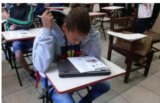
Aluna lendo o jornal

Os resultados dessa edição foram muito satisfatórios. O contato com os alunos se tornou mais forte e houve muita troca de experiências entre as pibidianas e os estudantes. Rapidamente elas se sentiram à vontade na escola Alice Loureiro, podendo contribuir no desenvolvimento e desempenho escolar dos alunos que sempre se mostravam interessados nas atividades propostas. Diante da boa repercussão da 1ª edição, não havia outra possibilidade: O “Alice em Ação” vai continuar. Se a primeira foi boa, as outras serão melhores ainda!