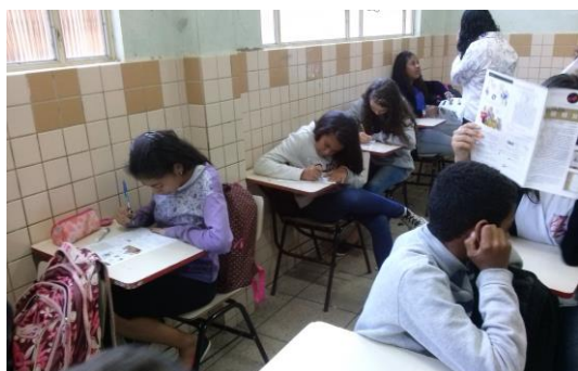
Entrega dos jornais