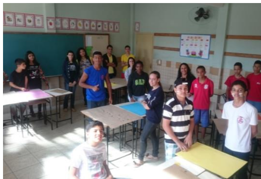
Alunos representantes de cada equipe preparados para a realização do desafio de biologia.