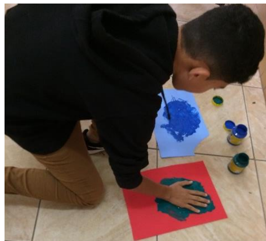
Participação dos alunos na construção do mural