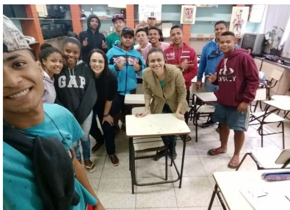
Alunos da Telessala das duas escolas