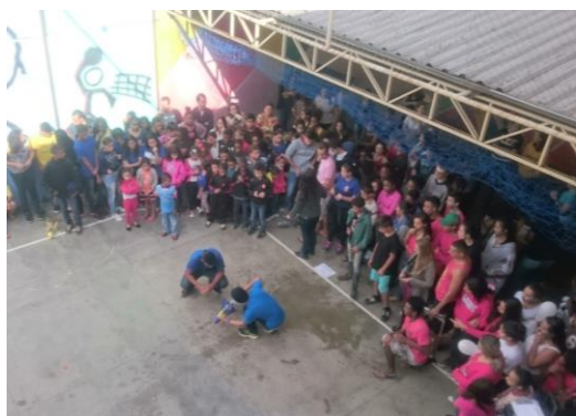
Desafio de física: confecção de um foguete.

No dia 06 de maio aconteceu mais uma vez a Gincana Interdisciplinar da EEAL, organizada principalmente pelo Pibid da Química em conjunto com toda a escola. Os alunos de diferentes idades foram organizados em cinco equipes e submetidos a vários desafios que iam desde apresentações de teatro e dança até desafios que necessitavam do conhecimento trabalhado dentro de sala de aula a partir de mais diversas disciplinas, como matemática, português, química, física e biologia. Além destes desafios, os alunos também recolheram alimentos não perecíveis, chegando num total de 42 cestas básicas, que foram doadas a quatro instituições (Pingo de Luz: Irmã Scheila, Casa de Acolhimento Esperança do Amanhecer, Lar dos Velinhos e Creche da Dona Efigênia), além de também atender a 18 famílias com o que foi adquirido. Os professores Délcio e Stella, de história, e Flávio, de sociologia, ajudaram na tarefa de distribuição dos alimentos.